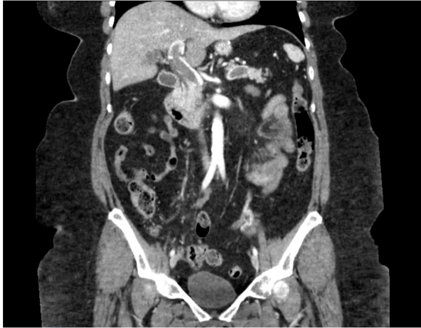
Figura 1. Imagen coronal de TC abdominal con hallazgos de trombosis masiva del eje espleno-portal y vena mesentérica superior.