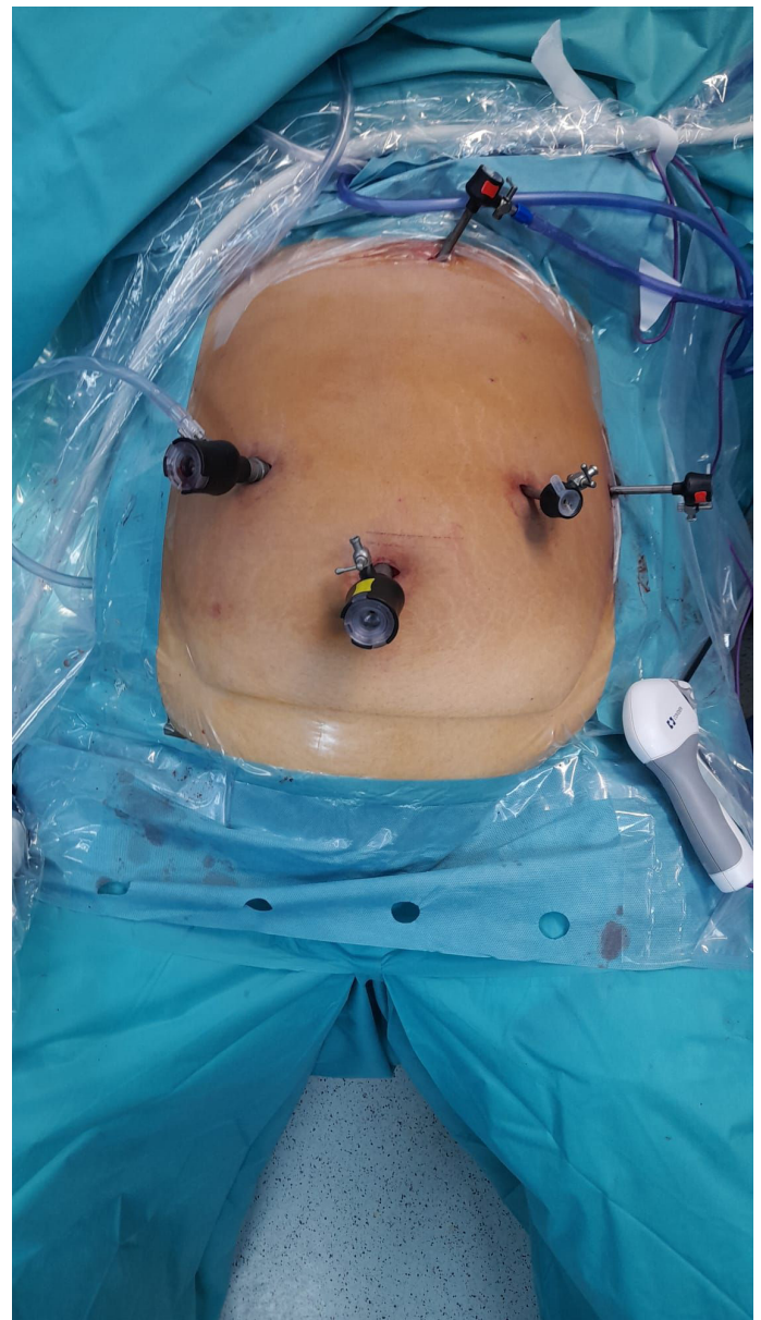
Figura 1 - Colocación del paciente y colocación del trócar

Se colocó al paciente en decúbito supino, con las piernas en abducción. Se utilizaron tres trócares de 5 mm y dos de 12 mm. (Figura 1)