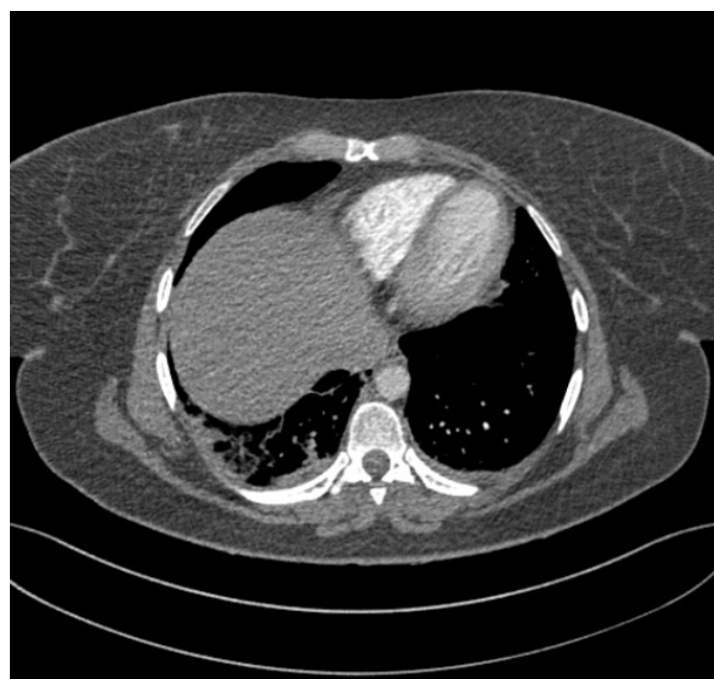
Figura nº 1: Angio-TC. Ventana aérea. Consolidación de parénquima pulmonar en pirámide basal derecha de morfología triangular, sugestivo de TEP agudo con pequeño infarto pulmonar asociado.

A los 2 días del alta, la paciente acude a Urgencias con dolor en hemitórax derecho sin disnea. Una analítica sanguínea mostró un Dímero D de 4199 µg/l y una Angio-TC evidenció defectos de repleción a nivel de arterias segmentarias y subsegmentarias de la pirámide basal derecha, que se acompañan de consolidación de morfología triangular y amplia base pleural en segmento posterior de dicho lóbulo inferior, hallazgos sugestivos de TEP agudo con pequeño infarto pulmonar asociado (Fig 1 y 2). La paciente reingresó con tratamiento anticoagulante de Enoxaparina 80 mg/12 horas. Durante el ingreso se efectuaron ecocardiograma y ecografía de miembros inferiores, ambas dentro de la normalidad. La paciente fue dada de alta al 4º día de ingreso en tratamiento con la misma dosis de HBPM e iniciando viraje a acenocumarol, que debería mantener durante 3 meses.