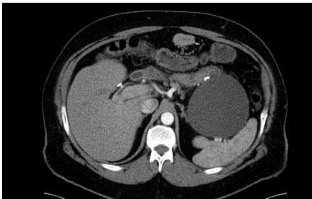
Figura 1: TC de abdomen con contraste: masa quística unilocular de 12 cm adyacente a los cambios postquirúrgicos del bypass, sugestiva de linfocele.