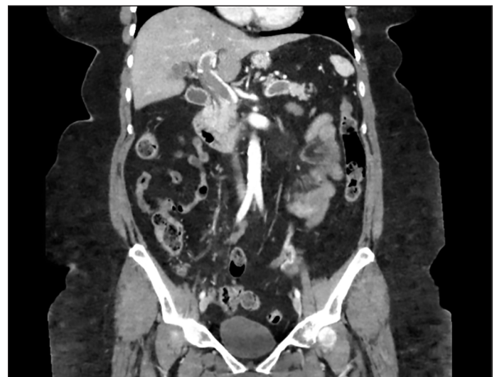
Figura 1. Imagen coronal de TC abdominal con hallazgos de trombosis masiva del eje esplenoportal y vena mesentérica superior.